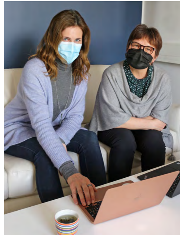
Ympäristöasioiden hallintajärjestelmää kehitetään yhteistyössä Ramboll Oy:n kanssa.